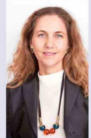
Rosario Navarro, presidenta de Sofofa.

Exponor constituye un polo de información sobre futuras inversiones y nuevas tendencias en materia de innovación y sostenibilidad, además de un escenario en donde converge lo mejor de la industria minera. Exponor es, sin lugar a duda, la vitrina internacional donde Chile muestra su potencial y se proyecta como un actor de clase mundial en esta industria. Asimismo, es una ventana para toda la cadena involucrada y una plataforma de articulación público-privada”.