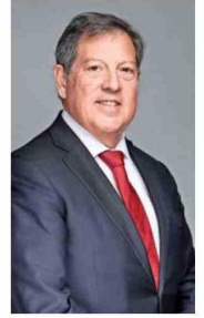
Jorge Riesco, presidente de Sonami.

Para Chile, y particularmente para una región minera como Antofagasta, contar con un espacio como Exponor tiene un enorme valor estratégico. Posiciona al país como un referente mundial en minería y también demuestra la capacidad de nuestra industria para atraer innovación, inversión y talento internacional. Hoy la minería enfrenta transformaciones profundas asociadas a la digitalización, la automatización, la sostenibilidad y la eficiencia operacional. Exponor permite conocer de primera fuente las nuevas tecnologías y tendencias que están marcando el futuro de la industria”.