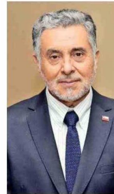
Hugo Briones, subsecretario de Energía.

Exponor es mucho más que una feria minera: es una vitrina del más alto nivel en la cual la energía muestra su valor estratégico para que la minería chilena siga creciendo, innovando y ganando competitividad. Exponor 2026 se está presentando precisamente como un espacio donde la energía y la minería convergen de manera estratégica. Estamos convencidos de que sin energía no hay minería del futuro y de que, sin minería moderna, Chile no puede liderar la nueva economía de la energía”.