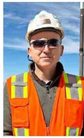
Boris Medina, presidente de Minera El Abra.

Participar en Exponor 2026 es una oportunidad estratégica para nuestra compañía. Esta feria se realiza en el corazón de la minería, lo que la convierte en el escenario ideal para mostrar las innovaciones de la industria, compartir conocimientos y fortalecer vínculos con proveedores de todo el mundo. Estar presentes nos permite proyectar el futuro de la minería, más sustentable y tecnológica”.