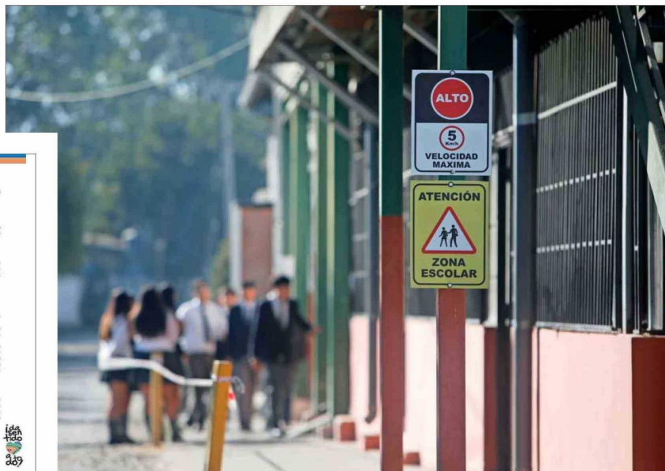
DENUNCIAS.— En la Región de Valparaíso, entre el 23 de marzo y el 13 de abril se registraron 101 denuncias por amenazas. El regreso a clases se realiza de forma permanente bajo resguardo policial.

El seremi de Seguridad de Valparaíso, coronel (r) Hernán Silva, indicó esta semana que las amenazas en establecimientos educativos tienen efectos concretos en la capacidad operativa de las policías: "(Llevamos) sobre 20 denuncias (en la región) por estas amenazas que instalan los alumnos en los colegios generando una distracción de personal policial que debiera estar focalizado en el combate a la delincuencia". Solo en la Región de Valparaíso, entre el 23 de marzo y el 13 de abril hubo 101 denuncias de amenazas. Además, cuando se retoman las clases, siempre es con el apoyo de