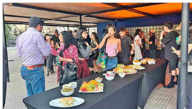
Los asistentes a la Avant premiere pudieron disfrutar de un coctel después de la función, con la posibilidad de interactuar con el director y los actores.