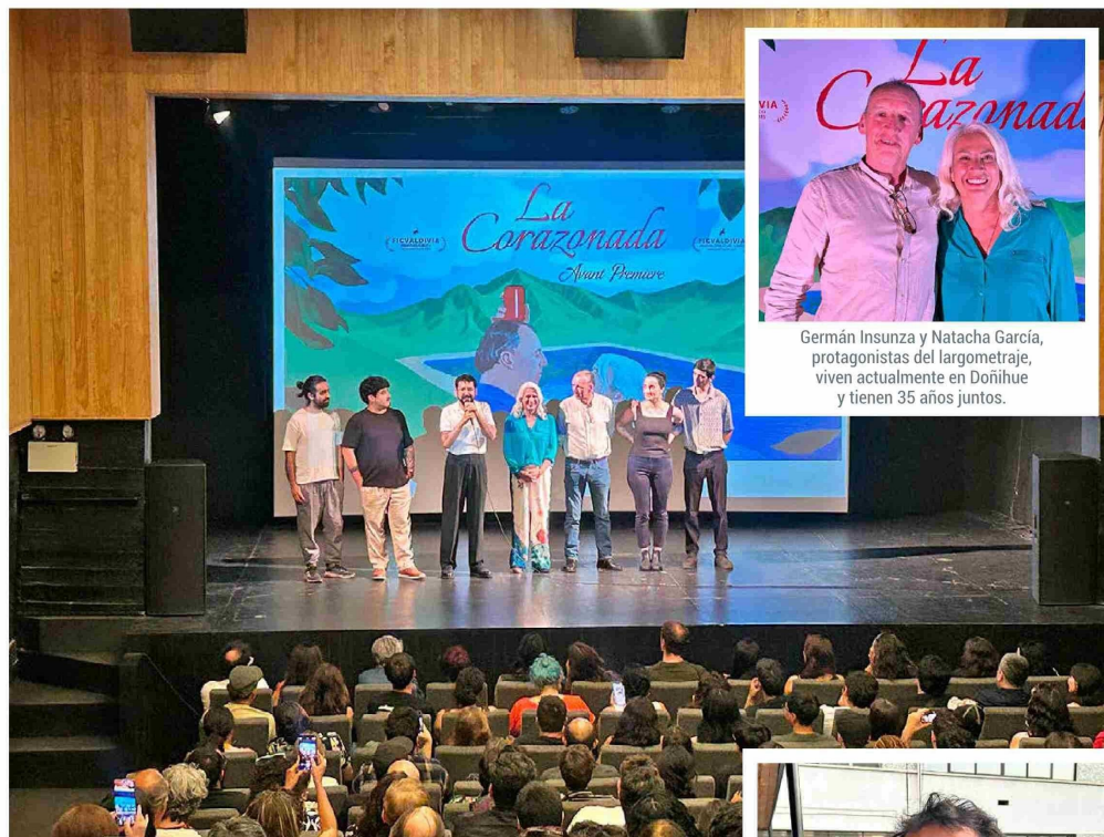
Previo a la proyección, el director junto al elenco agradeció a los asistentes.