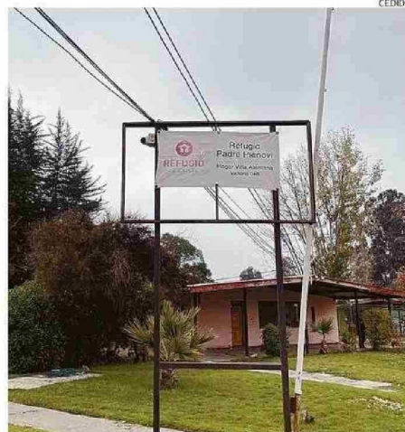
CIERRE SERÁ EL PRÓXIMO 31 DE MAYO. 8 NIÑOS SERÁN REUBICADOS.

"Hoy el Gobierno está mucho más quisquilloso (en la entrega de los recursos), nos exigen comprobantes, más trámites (para rendir), y eso a nosotros nos cuesta más dinero. Ha habido fundaciones que han te-