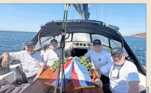
Excadetes de la Escuela Naval lanzaron una ofrenda floral en el mar Egeo, frente al templo de Poseidón, en las costas de Grecia.

surcaron el mar Egeo a bordo de cuatro veleros para rendir un homenaje "al valor, la entrega y el legado de los héroes que marcaron nuestra historia en el mar", escribiendo junto a indígenas de la conmemoración que compartieron en sus redes sociales. "Esta fecha tan significativa nos invita a recordar nuestros raíces y a renovar el compromiso con los principios y valores que inspiran a nuestra nación", añadieron.