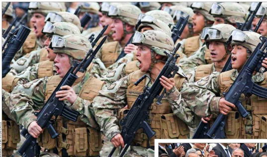
Honores. El Ejército retornó al desfile en Valparaíso. El despliegue de esa rama de la defensa incluyó a 309 efectivos, hombres y mujeres, los que marcharon al ritmo de "Los viejos estandartes".

Desfile en Valparaíso En la ceremonia central, realizada en Valparaíso, participaron más de 2 mil efectivos de las Fuerzas Armadas que homenajearon al capitán Arturo Prat, en un desfile que también marcó el retorno de contingente perteneciente al Ejército, que al son de la marcha "Los viejos estandartes" participó con 309 efectivos. Allí se congregaron las principales autoridades nacionales, encabezadas por el Presidente José Antonio Kast y algunos miembros de su gabinete. También estuvieron presentes los presidentes del Senado, de la Cámara de Diputados y de la Corte Suprema, el fiscal nacional (s) del Ministerio Público, el gobernador regional; el delegado presidencial, y el cardenal arzobispo de Santiago, Fernando Chomalí, junto a representantes de otras instituciones. El Presidente Kast entregó unas palabras tras la ceremonia, en las que llamó a reforzar los valores patrióticos y a recuperar