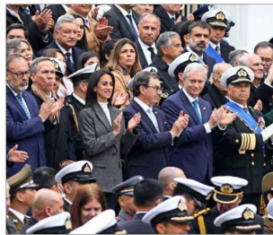
CEREMONIA — Las principales autoridades del país rindieron honores a los Héroes de Iquique, en la plaza Sotomayor, en Valparaíso.