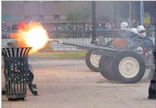
SANTIAGO — En la capital, la ceremonia incluyó disparos de salvas cañoneras para recordar el momento en que la "Esmeralda" quedó sumergida en la rada norte.