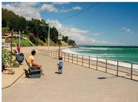
INCLUSO EN LA ZONA CERO, los destinos están completamente operativos, con restaurantes, cabañas, artesanos y actividades náuticas y deportivas.

De igual forma, agregó que desde el Ministerio del Trabajo también existe un bono de recuperación y retención del empleo, que subsidia hasta el 80% de un