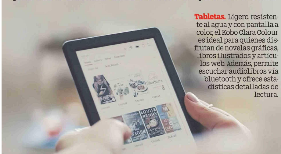
Gran almacenamiento interno. suficiente para una buena cantidad de libros electrónicos.

Tabletas. Ligero, resistente al agua y con pantalla a color, el Kobo Clara Colour es ideal para quienes disfrutan de novelas gráficas, libros ilustrados y artículos web. Además, permite escuchar audiolibros vía Bluetooth y ofrece estadísticas detalladas de lectura.