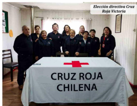
Elección directiva Cruz Roja Victoria

El salón, cargado de memoria y energía, ha sido testigo de controles de sa-