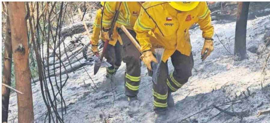
Las Brigadas terrestres siguen trabajando en asegurar las líneas de contención y cortafuegos para evitar que el fuego se extienda o avance en nuevas direcciones.

is brigadas forestales y cuerpos de bomberos que se lesplazaron entre provincias y desde otras regiones ara apoyar el combate de incendios ya iniciaron el retorno a sus ciudades de origen