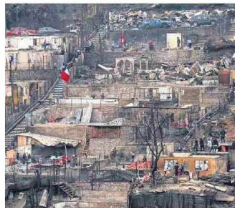
FFAA, y policías fortalecerán los patrullajes en zonas afectadas.

Debido a la inestabilidad del sistema frontal que dejará precipitaciones, incluso con posibilidad de granizos, se realizó un Cogrid regional para coordinar distintas instituciones.