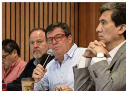
INTEGRANTES DEL COEVA APROBARON EL PLAN DE CIERRE DEL VERTEDERO.