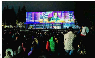
Frontis de la Biblioteca Central iluminado durante realización del videomapping "La Búsqueda del Conocimiento" que dio inicio a las celebraciones por el centenario de Bibliotecas UdeC.