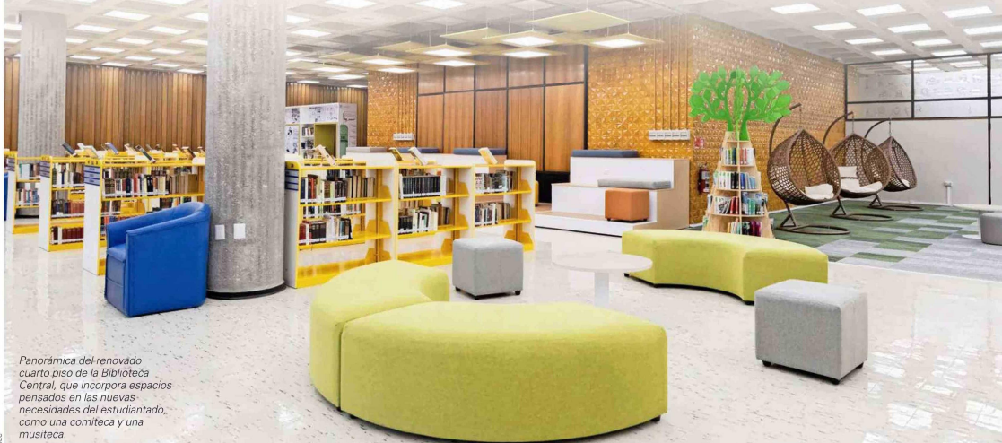
Panorámica del renovado cuarto piso de la Biblioteca Central, que incorpora espacios pensados en las nuevas necesidades del estudiantado, como una comiteca y una musiteca.

En el marco de su centenario, Bibliotecas UdeC desarrollará una programación que incluye intervenciones culturales, seminarios internacionales y una propuesta inédita de narrativa visual. "La búsqueda del conocimiento", que recorrerá sus tres campus.