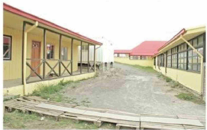
Deterioros, filtraciones de aguas lluvias, pisos rotos, fallas eléctricas por humedad, sobrecarga de alumnos y personal, son parte de las numerosas fallencias de un edificio, construido por la Sociedad Constructora de Establecimientos Educativos en 1946.