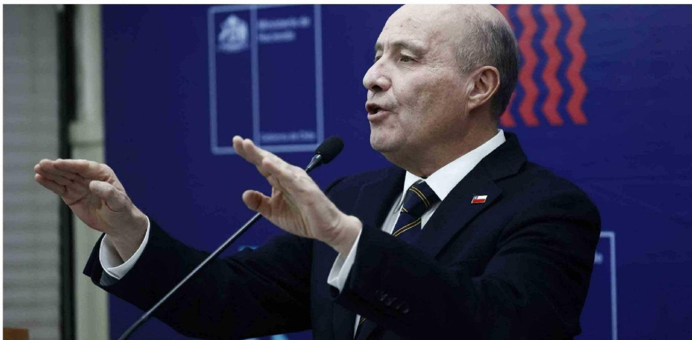
► Jorge Quiroz, ministro de Hacienda.