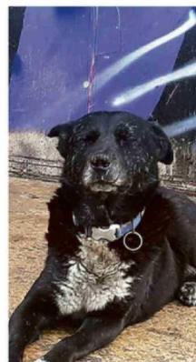
QUERIDO PERRO BLACK.

"En Valparaíso estamos enfrentando de forma seria el problema. Desde julio se han emitido 13 oficios para exigir que los propietarios se hagan cargo de sus propiedades con limpieza, cierres y mantenimiento. Es necesario buscar un protocolo que agilice el trabajo del municipio, especialmente de la Dirección de Obras Municipales, para tener mayor celeridad y actuar de manera