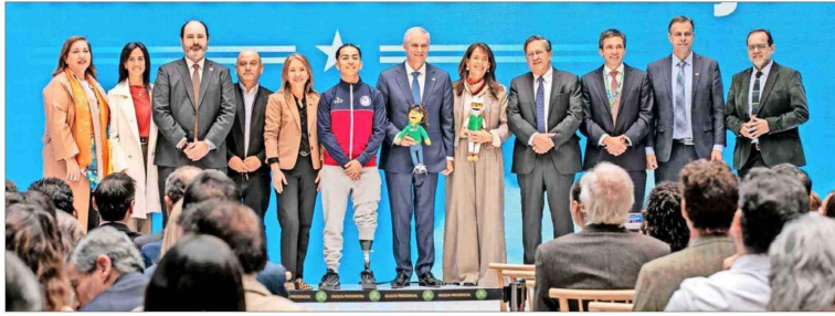
Presidente de la República, José Antonio Kast, junto a autoridades y representantes de la Achs.