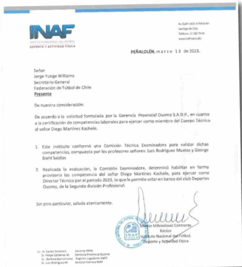
EL DOCUMENTO EN CUESTIÓN entregado por el INAF autorizando al actual técnico de P. Osorno para dirigir.

El próximo 10 de octubre a las 18 horas, ambas partes están citados presencialmente en tribunales de la ANFP.