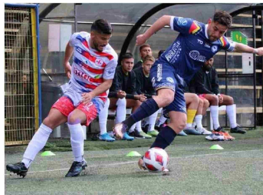
IBERIA Y P. OSORNO se volverán a ver las caras, ahora en tribunales.