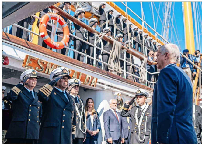
El Presidente José Antonio Kast visitó el buque escuela "Esmeralda", en la antesala del anuncio de la iniciativa.

El cambio de estrategia es directamente atribuido a la dupla política de La Moneda: los mi-