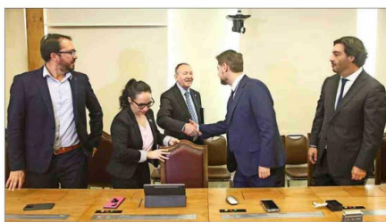
En un momento de la reunión, el PS optó por interrumpir el diálogo.

después de la reunión, la bancada del Frente Amplio emplazó al ministro García Ruminot a sostener una reunión, considerando que ha privilegiado las conversaciones con los sectores "más al centro" de la oposición, especialmente el PPD y la DC. El FA, a su vez, presentó un documento con medidas a tomar en cuenta para el proyecto, lo que incluye la creación de una mesa que se pronunciaría sobre las partes de la iniciativa susceptibles de prosperar.