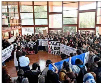
Los estudiantes permanecieron afuera del Aula Magna del campus Isla Teja, lo que impidió por largo rato la salida de los invitados al acto académico.

“Fui una bartender ; hice muchos trabajos, aprendí muchas cosas. Empecé de muy abajo”, relató en una charla. Luego de trabajar en el área gubernamental de EE.UU., entró al mundo tecnológico, donde fue CEO y cofundadora de BuildWithin, plataforma de capacitación y desarrollo laboral. Antes fue presidenta y cofundadora de Phone2Action, plataforma que conecta a miembros, seguidores y empleados de organizaciones.