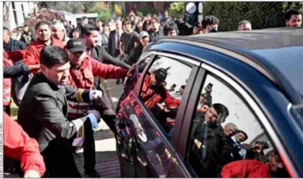
Escortada por su equipo y guardias de la UACH, la ministra salió corriendo del Aula Magna a eso de las 14:45 horas. Mientras intentaba llegar a su vehículo fue rodeada y agredida con empujones e insultos, además del lanzamiento de líquido.