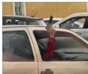
Los detenidos por este caso pasarán a control de detención hoy. En la imagen, uno de los imputados con el arma.

Este caso policial generó impacto, más aún luego del homicidio de una inspectora (59) del Colegio Instituto Olayo Silva Lezaeta en Calama (200 km al norte), perpetrado por un alumno del establecimiento (18) el 27 de marzo pasado.