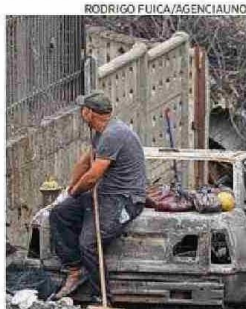
Los vecinos siguen trabajando.