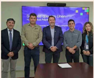
La firma del convenio se realizó en las oficinas de Kinross.

Si bien esta iniciativa no resuelve por completo el déficit estructural en salud bucal, sí representa un avance concreto en territorios donde las soluciones suelen tardar en llegar. En medio de una problemática país, acciones como esta evidencian el rol que pueden jugar las alianzas público-privadas para acercar la salud a quienes más lo necesitan.