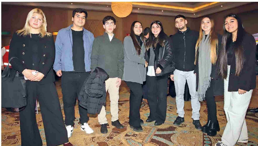
Estudiantes de INACAP Sede Rancagua.