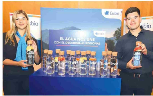
Stand de la sanitaria ESSBIO.