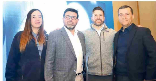
Stand de la empresa ME Elecmetal y sus encargados durante este evento.