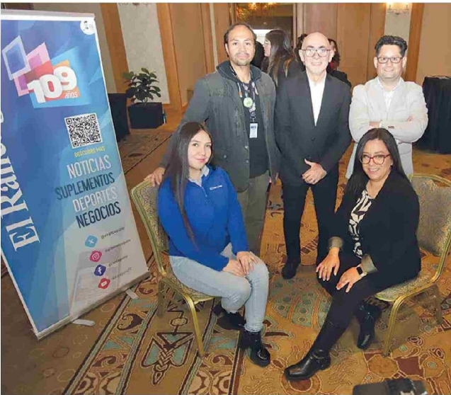
Parte del equipo de El Rancagüino encargado de la cobertura de ENEO 2025 desde Monticello.