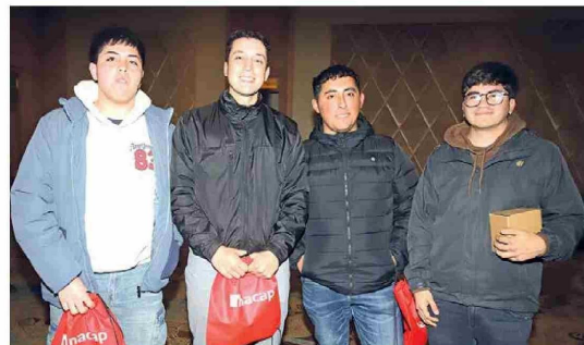
Estudiantes de INACAP Sede Rancagua.