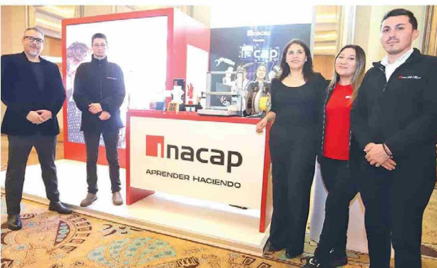
Punto de encuentro de INACAP en ENEO 2025.