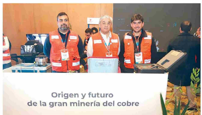
Espacio en que Codelco División El Teniente demostró a los asistentes a ENEO por qué es la gran compañía del cobre en Chile.