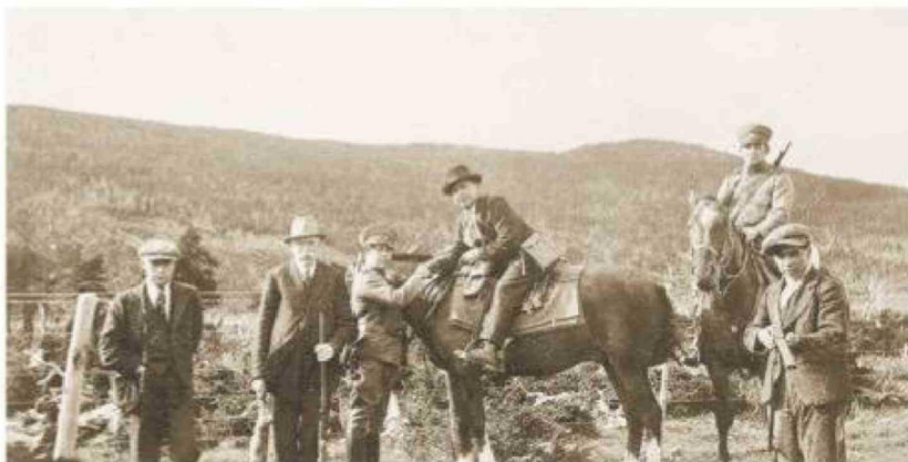
Policía rural en Magallanes, año 1928.