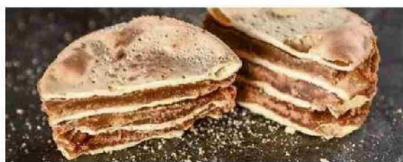
TORTA CURICANA, TODA UNA TRADICIÓN.

Degustamos unas irremplazables invitadas a la mesa. Su origen, desarrollo y evolución tienen un estrecho vínculo con la cultura occidental.