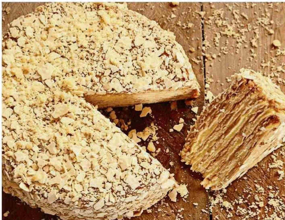
TORTA DE MIL HOJAS, UNA SOBERANA EN EL DISFRUTE DE LOS CHILENOS.

Eugenio Pereira Salas, Premio Nacional de Historia (1974) e historiador, en "Apuntes para la historia de la cocina chilena" (1943), hace un completo estudio, comprobando la presencia culinaria colonial de esta área repostera. En esta obra se insinuó que nuestra soberana es la torta de mil hojas (hojarrasca), favorita de Domin-