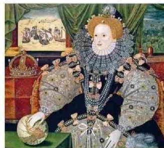
ISABEL I DE INGLATERRA (1589).

dad popular como chinganas, boliches, ranchos, quintas de recreos y picadas son parte del menú