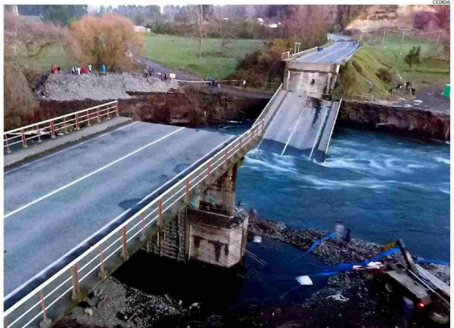
EL COLAPSO DEL PUENTE OCURRIÓ EL 18 DE JUNIO DE 2018 Y GENERÓ IMPACTO EN TODA LA COMUNIDAD DE LA PROVINCIA Y EL PAÍS.