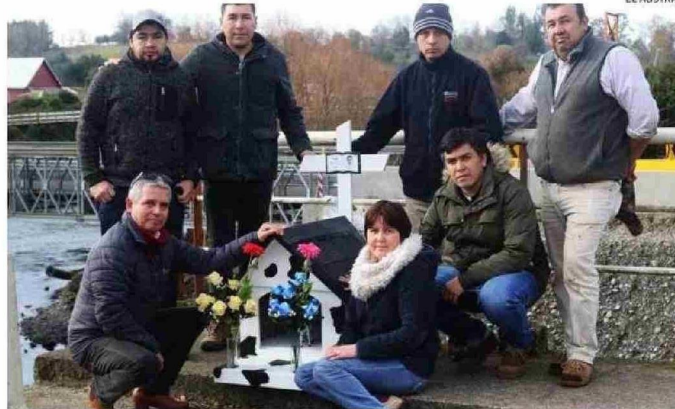
LOS PADRES DEL JOVEN FALLECIDO (JUNTO A LA ANIMITA), ACOMPAÑADOS DE PARTE DE LOS LESIONADOS.

formalizadas tres personas por cuasidelito de homicidio, cuasidelito de lesiones graves y menos graves por el Ministerio Público, que investiga el colapso del puente y sus causas.