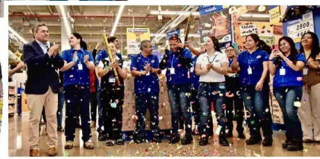
Inauguración Alvi Quilicura