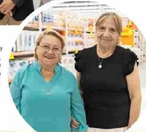
Inauguración Unimarc Las Brisas Norte, Colina.