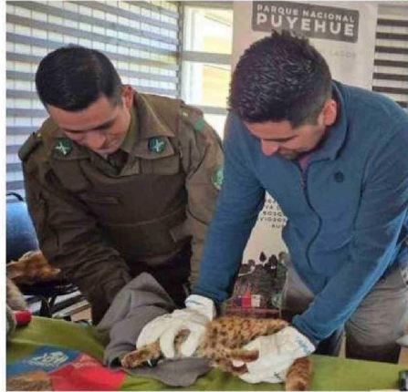
PERSONAL DE CARABINEROS TAMBIÉN ES CAPACITADO PARA RESCATES..