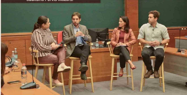
El panel aborda los principales desafíos del trabajo en el país.