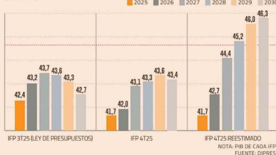
DEUDA BRUTA Y LA TRAYECTORIA REESTIMADA (% DEL PIB)

distintas variables del modelo y detectó la brecha. “Esa detección es la razón principal por la que la publicación del informe se postergó: publicar cifras inconsistentes habría sido un error mayor”, agregaron.