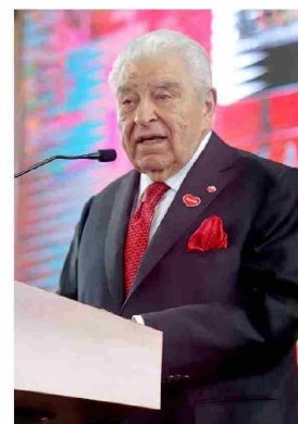
Mario Kreutzberger, don Francisco agradeció la construcción de la obra.