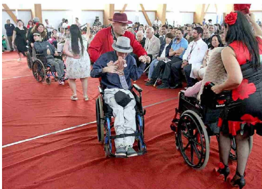
En la cita hubo cueca inclusiva con el Grupo Folclórico del Colegio Divina Esperanza.