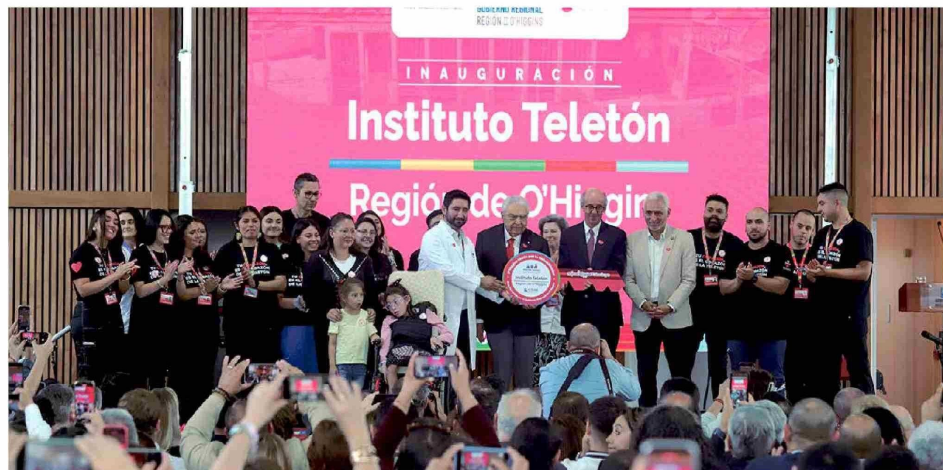
En la cita se realizó una entrega simbólica de llaves traspasando el Instituto Teletón a la fundación que hoy la administrará.