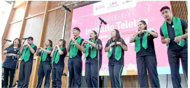
Se presentó el Coro de la Escuela Juan Tachoire Moena de Machali