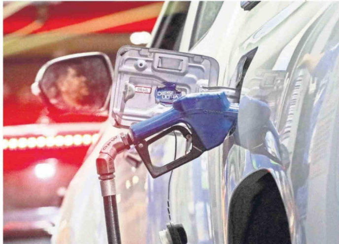
EL ALZA DE LOS COMBUSTIBLES INCIDE DIRECTAMENTE EN TODA LA CADENA LOGÍSTICA ALIMENTARIA.