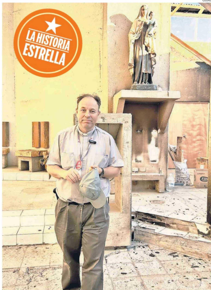
EL CAPELLÁN DE FUNDACIÓN LAS ROSAS HA ESTADO TRABAJANDO EN PENCO Y PUNTA DE PARRA.

acompañamiento emocional y espiritual junto al apoyo material y sanitario?