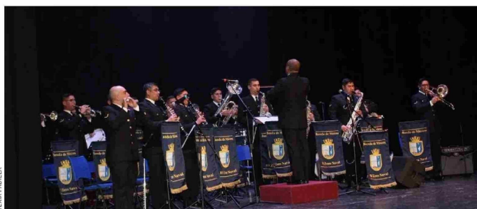
La Tercera Zona Naval abre en mayo una nutrida agenda de actividades abiertas a la comunidad.

Con este evento, la Tercera Zona Naval abre una nutrida agenda de actividades abiertas a la comunidad durante mayo, reafirmando el compromiso de consolidar un Chile verdaderamente marítimo.