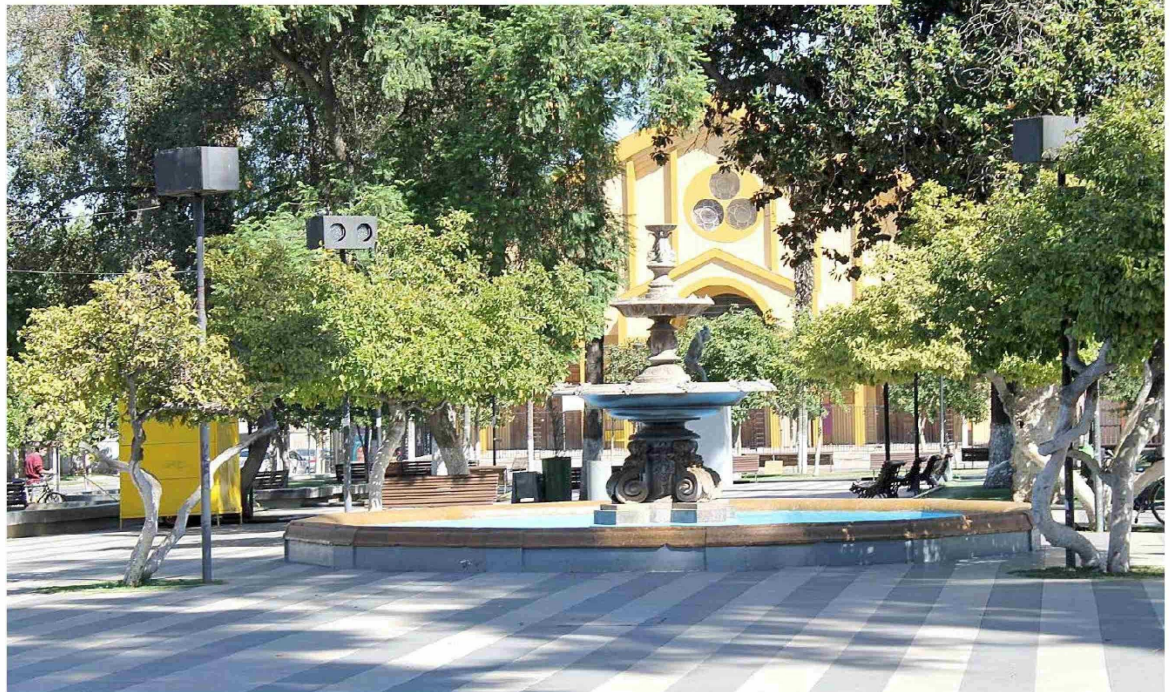
La Plaza de Armas de Rengo, una de las postales de la ciudad.