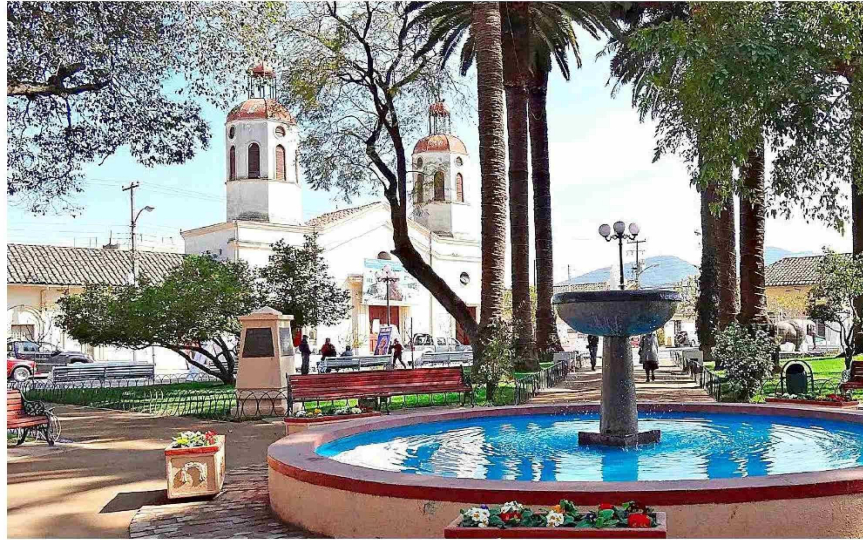
San Vicente desciende desde un nivel medio bajo a nivel bajo entre 2015 y 2025.

San Vicente: desciende desde un nivel medio bajo a nivel bajo entre 2015 y 2025, Se registran caídas