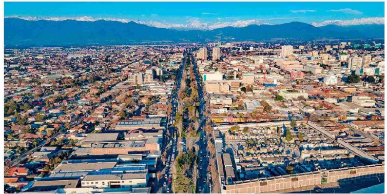
Rancagua, se mantiene la estabilidad en, vivienda, condiciones laborales y condiciones socio culturales, las condiciones de salud mejoran, mientras que el ambiente de negocios y las condiciones conectividad disminuyen.