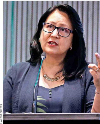
La contralora general de la República, Dorothy Pérez.

El cuestionamiento recuerda la discusión que motivó un duro intercambio entre el presidente de Codelco, Máximo Pacheco, y el ministro de Hacienda, Jorge Quiroz, cuando este último aún no era parte del gobierno del Presidente José Antonio Kast. En mayo de 2025, un estudio realizado por la consultora Quiroz & Asociados calculó que el Estado dejó de percibir US$ 5.200 millones porque Codelco realizó un trato directo con SQM para asociarse en el salar de Atacama, en vez de realizar una licitación pública. Pacheco, en ese entonces, argumentó que una licitación habría retrasado la entrada del Estado al salar de Atacama.