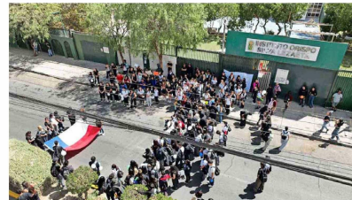
"Acá no llegas y consigues una hora con un psiquiatra, cuesta un mundo. En la zona tenemos cuatro psiquiatras a nivel comunal y ningún infanto-juvenil", afirma la directora. En la foto, una manifestación de los estudiantes.