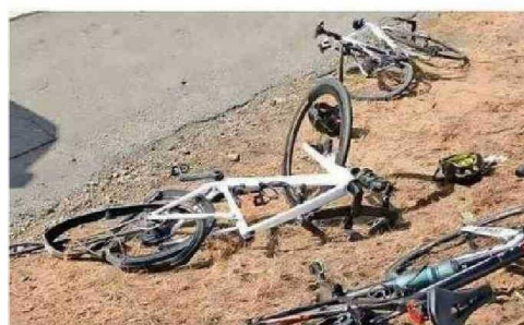
MOUAT IBA CON SU HIJO Y AMIGOS CIRCULANDO POR LA RUTA 5 SUR.

que se quedó dormido al volante: habían salido desde Santiago, en la noche, de vacaciones con rumbo al sur.