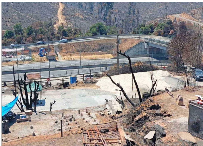
DESTRUCCIÓN. — En la Población El Pino solo quedaron los cimientos y algunas murallas de las casas que fueron incineradas el sábado pasado por la noche.

Residentes cuentan cómo "ráfagas de fuego" consumieron sus viviendas y que ya temen por las condiciones en que recibirán el invierno. Necesitan, dicen, materiales para la reconstrucción y elementos básicos como toallas y pañales.