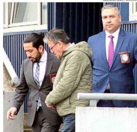
GERVOY PAREDES FUE DETENIDO EN OCTUBRE DE 2024 LUEGO DE SER DESTITUIDO COMO ALCALDE DE PUERTO MONTT EN AGOSTO DE ESE MISMO AÑO.

querrelante en representación del Consejo de Defensa del Estado (CDE), anunció que la entidad revisará el contenido del documento para establecer el grado de acuerdo con el Ministerio Público o determinar la