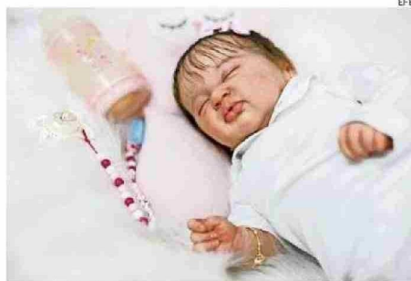
LAS RECIÉN NACIDAS TRAEN HASTA LAS MARCAS O PINCHAZOS DE VACUNA.

Las coleccionistas niegan usarlas de forma poco ética y