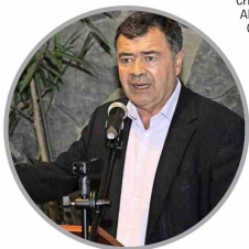
El ministro de Agricultura, Esteban Valenzuela, quien, entre otros puntos, destacó los avances de nuestro país en materia de sustentabilidad alimentaria.