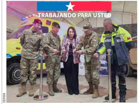
Hoy en Agrupación de Comandos Lientur del Regimiento N°10 Pudeto, se realizó la ceremonia de entrega del móvil SAMU en desuso a Macro Zonal Salud a fin de fortalecer su flota vehicular.