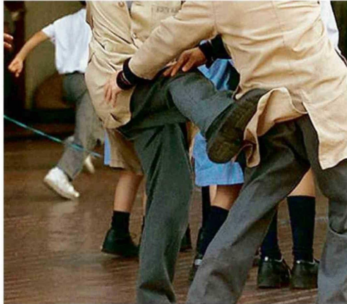
LA MESA BUSCA REFORZAR LOS PROTOCOLOS EN LOS ESTABLECIMIENTOS EDUCATIVOS.

“En materia de seguridad y para combatir el delito, es importante que las instituciones del Estado trabajen en conjunto. En este caso, Policía de Investigaciones con Educación, estamos trabajando desde la base, desde los liceos, donde se han observado algunos tipos de actos delictuales y obviamente queremos revisar los protocolos de actuación de ellos”,