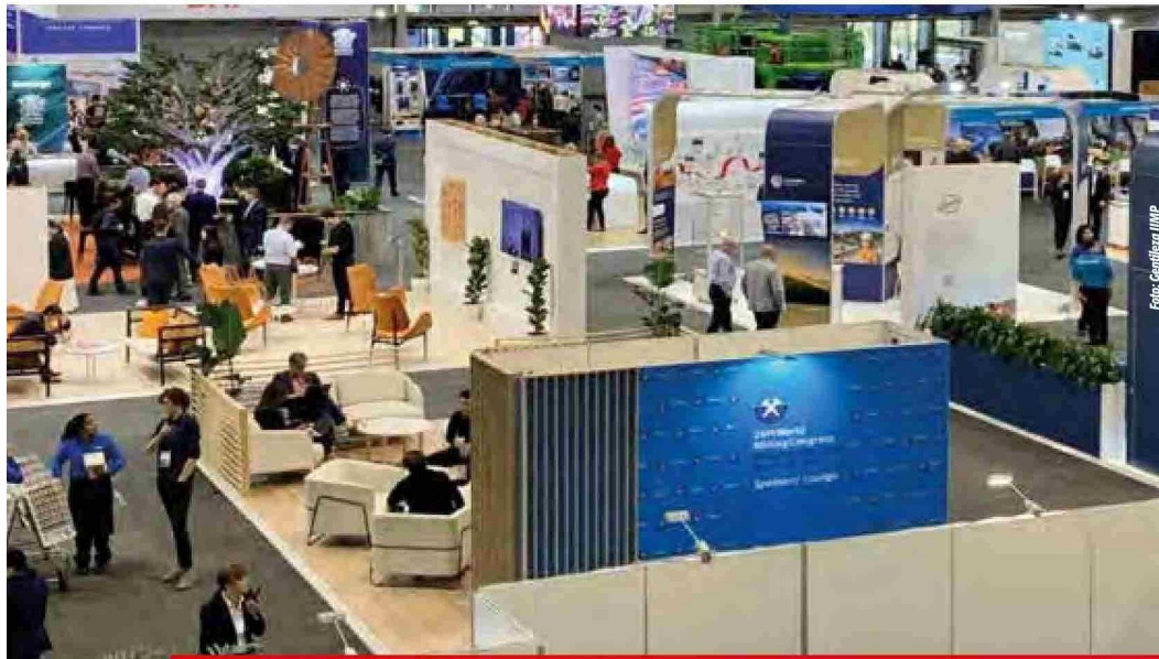
La feria se llevará a cabo entre el 24 y el 26 de junio en Lima

puestas concretas para el futuro de la minería.