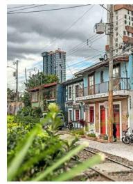
ENTRE BARRIOS. Casas viejas, cafés y nuevas torres conviven a poca distancia.