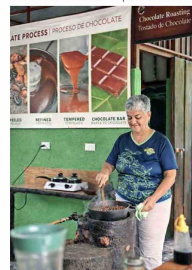
LA FORTUNA. En esta plantación puede ver el cultivo y tostado de cacao y café.

Si, era evidente que Barrio Amón no destacaba por las sodas. También, que muchas de sus construcciones mostraban sin disimulo el paso del tiempo. Pero el esplendor cafetalero de antaño todavía se percibe en las mansiones de madera antigua que resguardan un enorme valor histórico tras sus fachadas, aunque sin restauración sucumban al inexorable paso del tiempo.