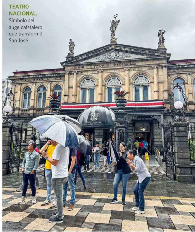
TEATRO NACIONAL. Símbolo del auge cafetalero que transformó San José.