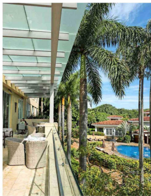
ESCAZÚ. El Club Lounge del hotel Intercontinental refleja el nuevo polo residencial y corporativo de alto nivel en San José.

TEXTO Y FOTOS: Constanza de Ramón, DESDE COSTA RICA.