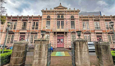
LEGADO. La Escuela Buenaventura Corrales es otra de las herencias que dejó para la ciudad la época de gloria del negocio del café.