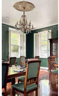
SILVESTRE. Este restaurante ocupa una casa de fines del siglo XIX.

Escazú solía ser un lugar agrícola ubicado en las laderas de los cerros. Un territorio de clima amable, separado de San José por una geografía más rural, en donde circulaban antiguas leyendas de curanderos, brujas y relatos sobrenaturales. Cuando el centro histórico comenzó a congestionarse, entre los años 70 y 90, las nuevas élites buscaron mejores condiciones residenciales, y migraron a terrenos más grandes en las afueras del valle urbano. Todo este movimiento transformó a Escazú en uno de los principales polos económicos de la alta sociedad costarricense. No era casualidad, entonces, encontrarse con la producción de los Guns.