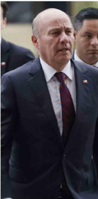
El ministro de Hacienda, Jorge Quiroz.