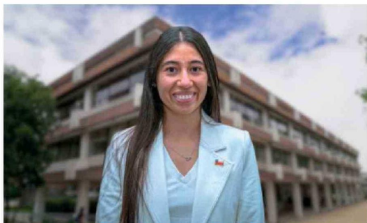
TERESA CARRASCO, seremi de Educación se refirió al hecho remarcando la necesidad de fortalecer herramientas preventivas en los establecimientos educacionales, como la revisión de mochilas y el refuerzo de la autoridad docente.

El caso continúa en investigación, mientras la comunidad educativa enfrenta un nuevo episodio que reabre el debate sobre la violencia escolar y la urgencia de fortalecer medidas concretas para prevenirla.