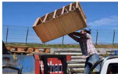
INCANSABLE ES EL TRABAJO QUE SE REALIZA EN EL PROGRAMA "CHAO CACHUREOS".

El éxito y alta convocatoria del "Chao Cachureos", han traído un aumento de cobertura y frecuencia. Respecto al este buen resultado, el alcalde de Temuco, Roberto Neira, manifestó que "es un orgullo que esta iniciativa, que impulsamos cuando llegamos al municipio hace casi cinco años, haya retirado más de 2.200 toneladas de basura de gran volumen, contri-