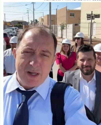
Poduje recorriendo un edificio parado por Conaf en Viña, mostrando un sitio fiscal eriazo en El Bosque, y con un alcalde PS y dirigentes en Padre Hurtado.