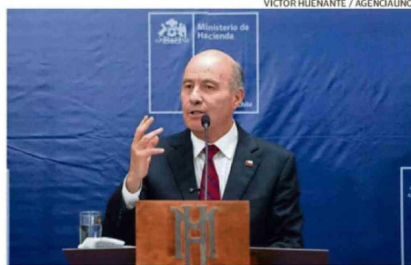
QUIROZ SUMÓ MEDIDAS A LAS ANUNCIADAS POR KAST.

proyecto. "No tiene ninguna lógica lo que están planteando y que lo hagan antes de leer el proyecto me parece absurdo", comentó.