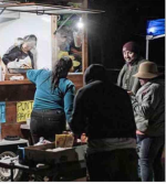
Un carro de comida, instalado en la cancha de Punta de Parra, llega en la noche para regalar café y alimentos, gracias a la iniciativa de un particular.