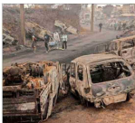
El poblado portuario de Lirquén, la "zona cero" de la emergencia, concentra la mayoría de las víctimas fatales.

sona que nosotros hemos individualizado como responsable, pero en este sentido soy cauta de no descartar otras causas de este incendio", indicó la perscrutadora.