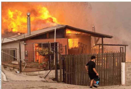
INFLEXIÓN.— A las 18.00 horas del 2 de febrero de 2024, el fuego de pronto enfrió a la ciudad, con un peak en su velocidad de propagación.

El documento de 81 páginas fue ingresado por el procurador fiscal del Consejo de Defensa del Estado en Valparaíso, Michael Willendorff, al Primer Juzgado Civil. En él opone a la teoría de la desidia estatal de los demandantes una alternativa: "El Estado tiene el deber jurídico de actuar, pero no la obligación de lo imposible", ya que tal incendio forestal "adquirió una categoría de Evento Extremo de sexta o sépti-